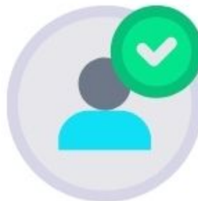
Proses verifikasi oleh MATARAMKOTA-CSIRT