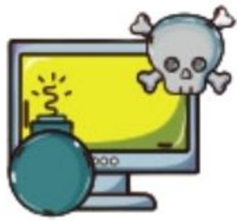
Terjadi Insiden Siber

Dinas Komunikasi dan Informatika Kota Mataram membuka layanan aduan siber bagi masyarakat dan perangkat daerah yang menemukan atau mengalami kendala ataupun insiden terkait keamanan siber.