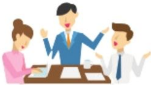
Tindak lanjut oleh MATARAMKOTA-CSIRT