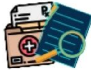
Kumpulkan bukti insiden (foto/screenshot/log) yang ditemukan