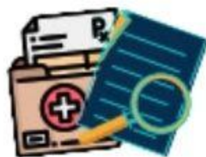
Kumpulkan bukti insiden (foto/screenshot/log) yang ditemukan