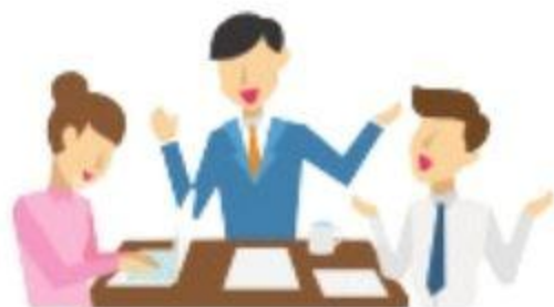
Tindak lanjut oleh MATARAMKOTA-CSIRT