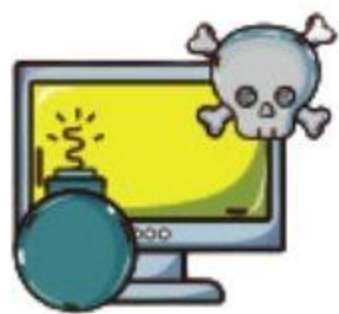
Terjadi Insiden Siber

Dinas Komunikasi dan Informatika Kota Mataram membuka layanan aduan siber bagi masyarakat dan perangkat daerah yang menemukan atau mengalami kendala ataupun insiden terkait keamanan siber.