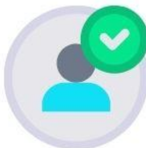
Proses verifikasi oleh MATARAMKOTA-CSIRT